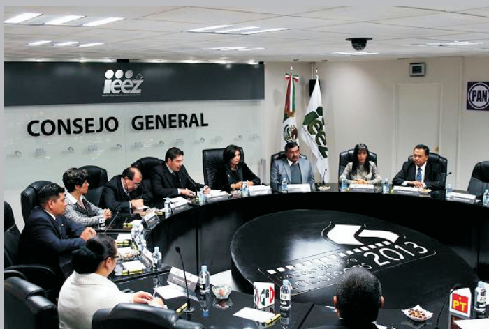
Sesión de Inicio del Proceso Electoral 2013